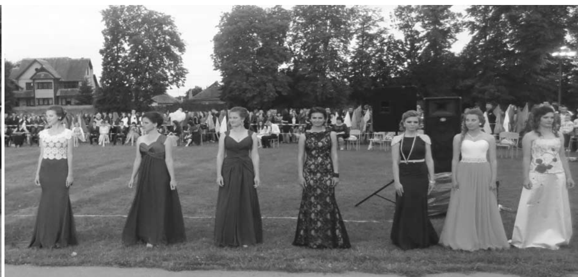
Дергачівська гімназія № 3