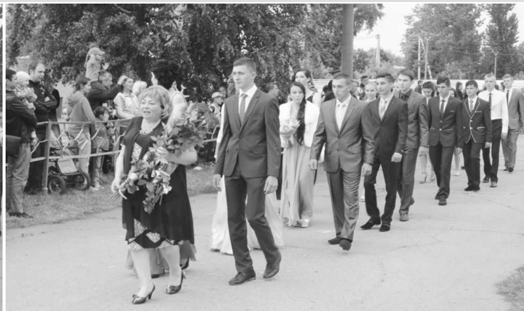
Дергачівський ліцей № 2, 11-Б клас