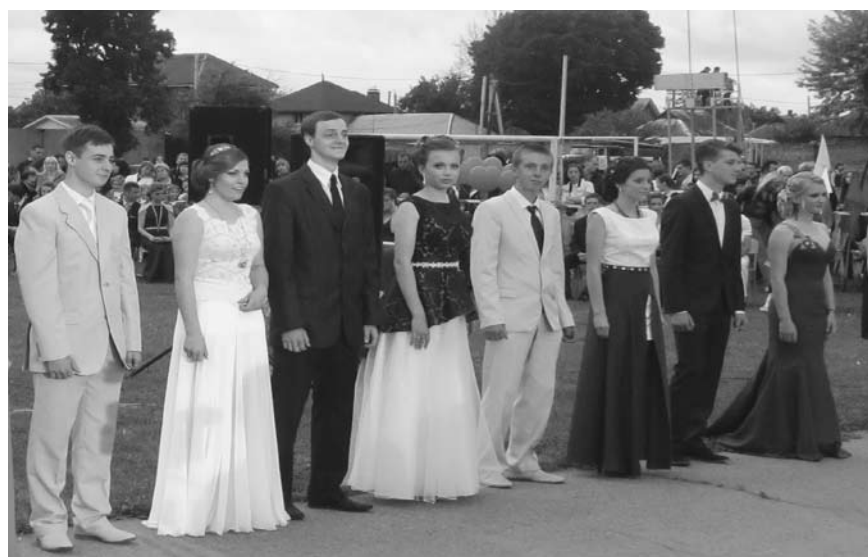
Дергачівський ліцей № 2, 11-А клас

Кульмінацією випускного балу стала презентація випускників, випускання голубів, блок «Дитинство», підготовлений колективами Будинку культури, феєричний виступ «Іст-фаєр», який, запаливши прометейський вогонь, зібрав на заключну пісню всіх випускників.