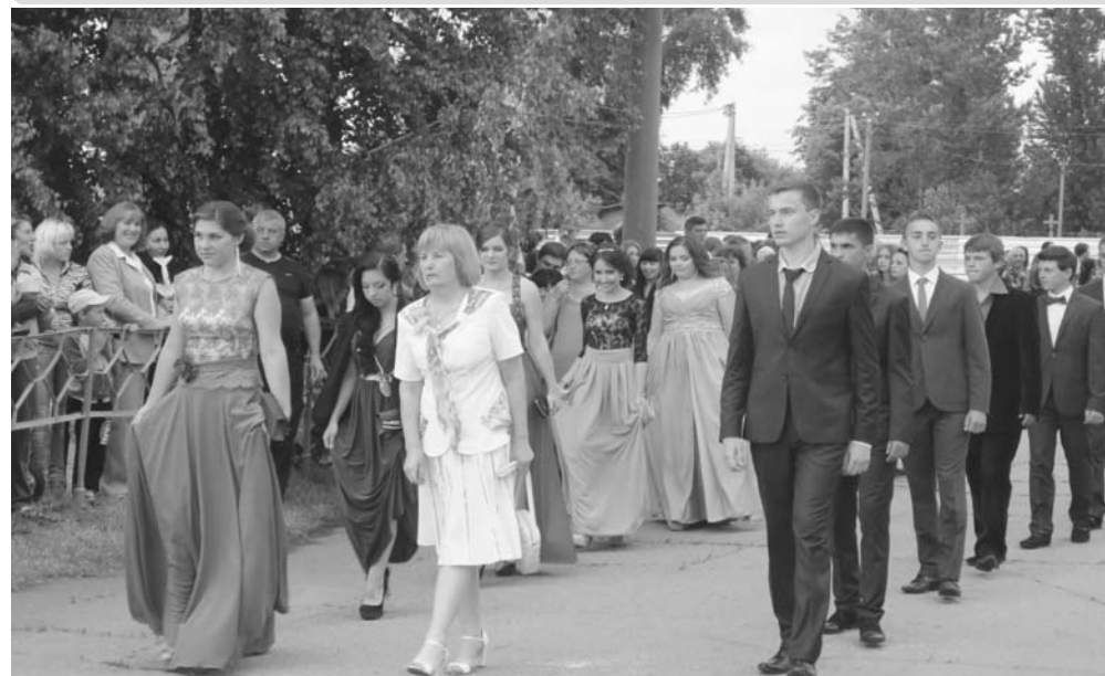
Дергачівський НВК «Загальноосвітня школа I-III ступенів – дошкільний заклад»

Перемог блискучих досягайте, рідну школу не забувайте!